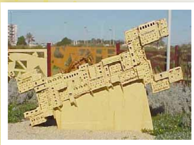
ראש מנוע -