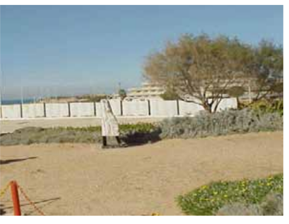
קיר הזיכרון -