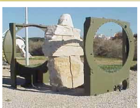
עוצב ע"י האדריכל זלמן עינב