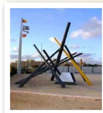
"הנה אני מביא בכם רוח וחייתם" (יחזקאל ל"ז, ה').